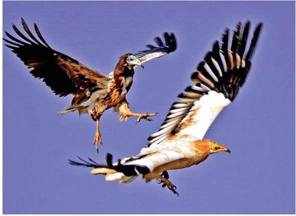
वनकर्मियों को दिया जा चुका प्रशिक्षण

गिद्धों की शीतकालीन गणना इस बार 20 फरवरी से आरंभ होगी। जो तीन दिनों तक चलेगी। गिद्धों की यह गणना श्यापुर जिले के जंगल में ही नहीं अपितु भ्रम के सभी जिलों के जंगल में एक साथ होगी। खास बात यह है कि इस बार गिद्धों की गणना डिजिटल तरीके से होगी। गणना का डाटा एप के जरिए ऑनलाइन दर्ज किया जाएगा। इस गिद्ध गणना की तैयारियां श्यापुर जिले में सामान्य वन मंडल और कूनो वन मंडल की ओर से पूरी कर ली गई है। दोनों वन मंडल का अमला सुबह के समय एक घंटे अपने अपने क्षेत्र में गिद्धों की गणना करेगा।