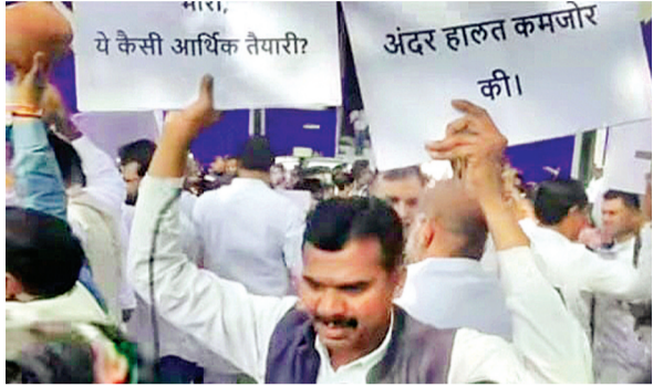
जोरा विधायक के काउंटर पर मड़के मंत्री